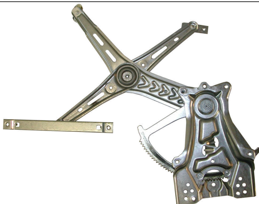
ORIGINAL POWER WINDOW LEFT ALZACRISTALLI ELETTRICO ORIGINALE SX

LA PRESENTE ISTRUZIONE VALE SIA PER IL LATO SINISTRO CHE PER IL LATO DESTRO.